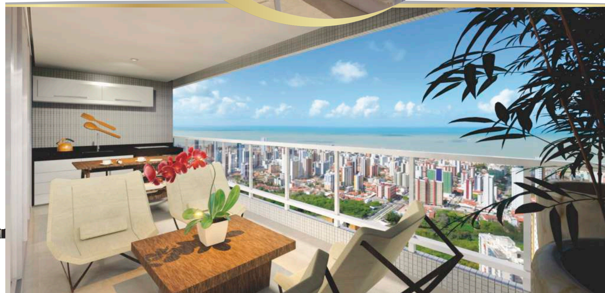
detalhamento em corte: varanda ampliada dos pavimentos 22º ao 30º