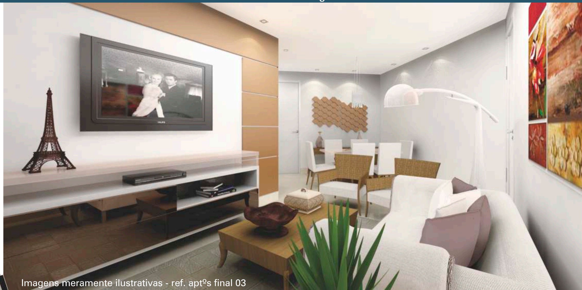
Imagens meramente ilustrativas - ref. apt's final 03