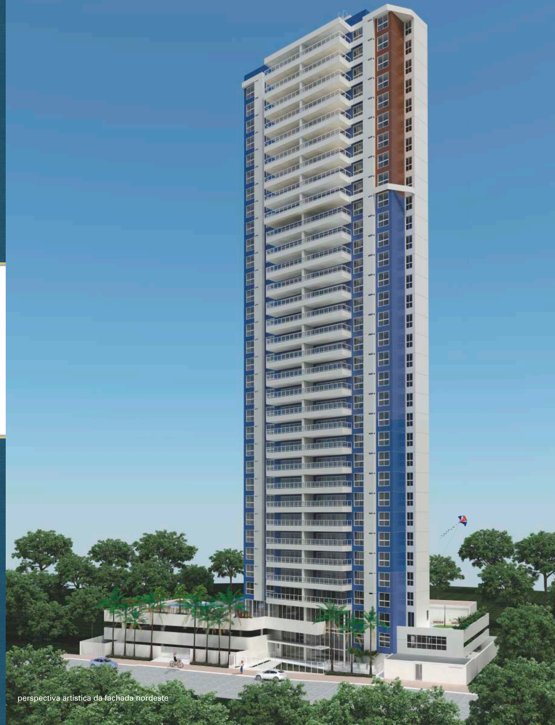
perspectiva artística da fachada nordeste